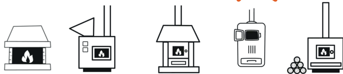
CAMINETTI APERTI, CAMINI CHIUSI, STUFE, INSERTI E CUCINE A LEGNA O PELLETT, CALDAIE ALIMENTATE A PELLETT O CIPPATO